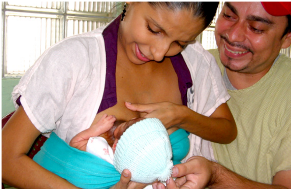
Los padres practican juntos el Método Madre Canguro en El Salvador.

En El Salvador, la principal maternidad atiende más de 14,000 nacimientos cada año. El 18% de estos bebés nacen prematuros y las salas neonatales